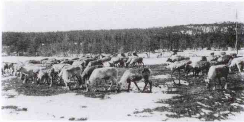
Ingen makt kan hindra renarna på våren att bege sig till fjälls.

använder sig dock av namnet lapp, då källmaterialet i huvudsak använder sig av detta namn.