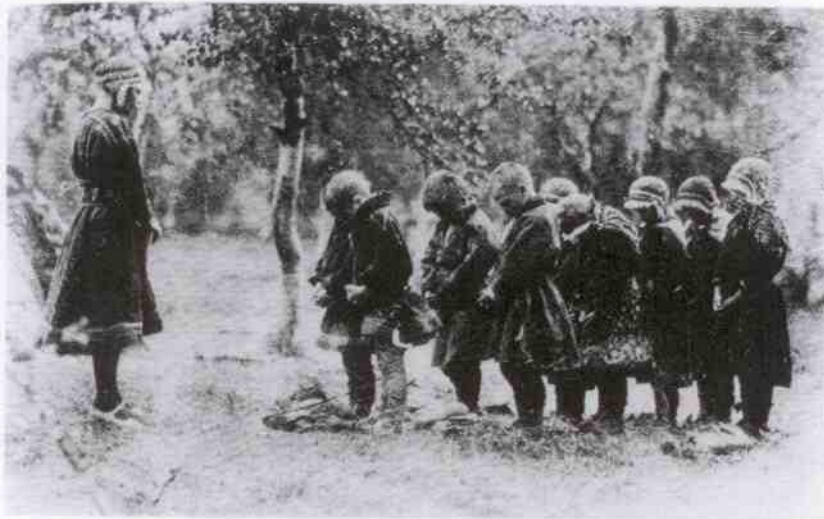
Nomadskolbarn förrättar sin morgonbön ute i det fria intill kåtan i fjällen.

och med vållade hans död. I öppen strid vågade de ej möta honom, då han var både stark och trollkunnig.