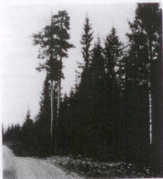
»Adam och Eva» är två tallar av anseelig storlek intill landsvägen Locksta-Lägsta, vilka Kronan låtit fridlysa.

Under den utpräglade bytes- eller självhushållningens tid, låt oss säga under 1800-talet, då kontanta medel var ringa räknat i riksdaler, skilling, styver och runstycken, gällde det att dra sig fram på vad den egna gården, jakten och fisket kunde ge. Ett led i denna