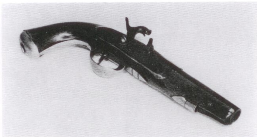
Postpistol från 1850-talet. I författarens ägo.

Postkontor inrättades även i Bjästa (Bjästad), och därmed förhöll det sig så, att landshövdingen i Västernorrlands län, vilken hade sitt residens i Gävle, i en skrivelse till Kungl. Maj:t av den 9/11 1752 föreslog Bjästa i Nätra socken som lämplig plats för ett postkontor mellan Härnösand och Umeå, ty i Nätra finns »tre prästgäll i trakten och där åstadkommes det bästa lin och de finaste spånader och vävnader i länet». Postkontor inrättades genom kungl. brev av den 6/3 1753, varvid särskilt framhölls, att Bjästa var beläget mellan Umeå och Härnösand samt vid landsvägen, varför postföringskostnaderna ej skulle öka.