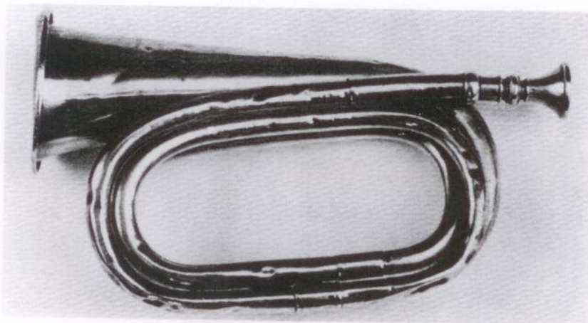
Posthorn som postdrängen blåste i, när han närmade sig postbyte.

utrustad med posthorn, en vapenbricka på bröstet, som visade att han var behörigt postbud, samt ett spjut som försvarsvapen. Att postdrängen var rustad med vapen var nödvändigt, då rånöverfall förekom i betydande utsträckning. Under 1800-talet utrustades postföraren med pistol.