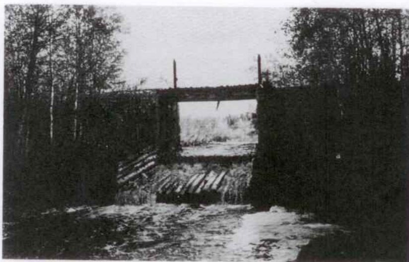
Som ett monument över gångna flottningstider står Abydammen i Björna lillå.

Gide och Björna. Aboar från Berg, Backe och Hemling utförde den mesta flottningen i Hemlings lillå, och i Björna lillå var det mest arbetare från kyrkbyn, Nybyn, Uttersjö, Hundsjö och Ryssjö. I Ledingsån ombesörjde åboar från Leding flottningen. Detta är endast några exempel.